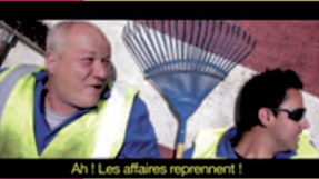
Ah ! Les affaires reprennent !

Film d'Alain PITON. E.S.A.T. l'Épi de Montfavet - Fr 2013